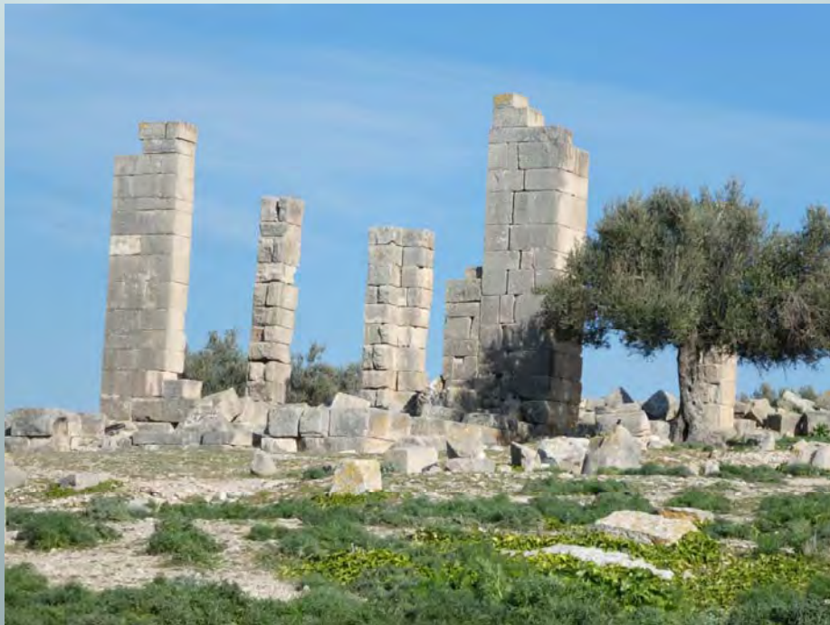
Le site de Thignica, aujourd'hui Aïn Tounga a été occupé par les romains et les byzantins.