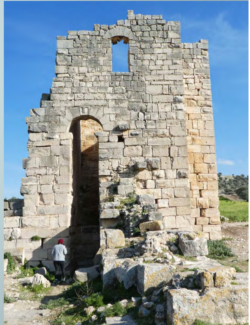
La forteresse byzantine