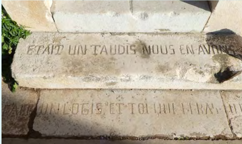
Inscription « récente » sur les marches de la maison à l'entrée du site.