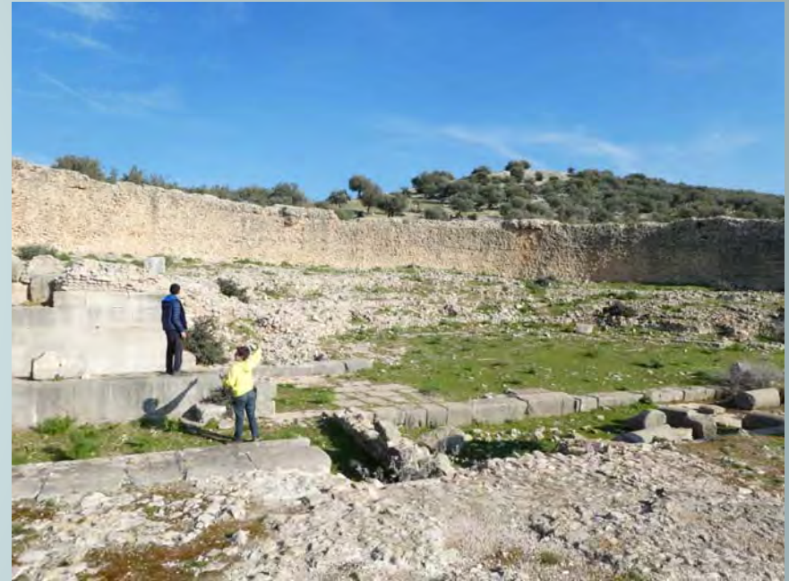
Le théâtre romain ou le monument semi circulaire